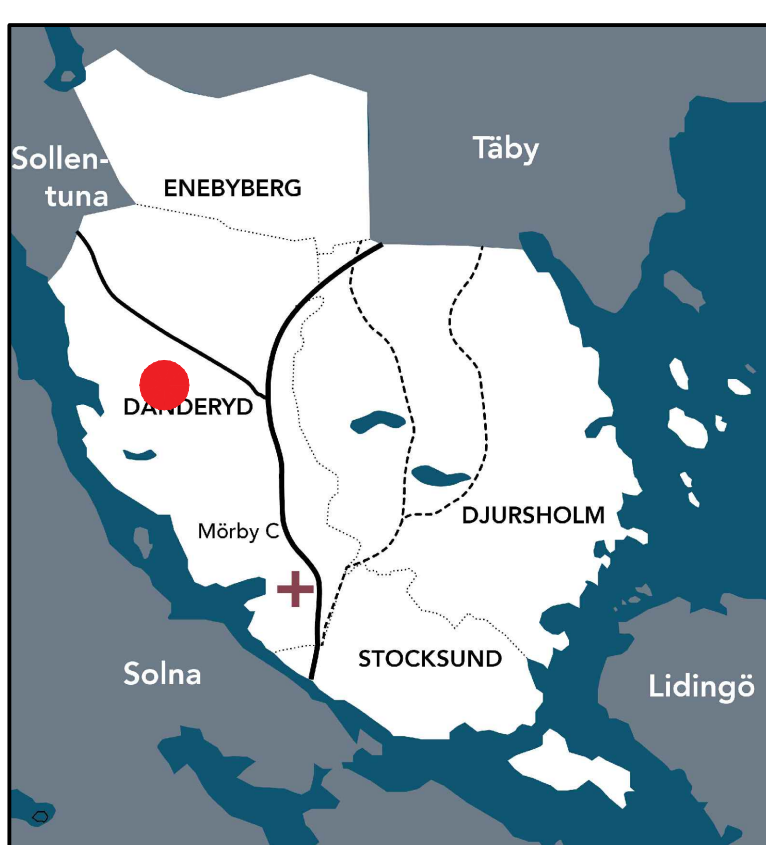
● Planområdets läge i kommunen

Planändring Bestämmelserna d 1 , d 2 , d 3 och d 4 gäller inom rödstreckade områden. d 1 Minsta fastighetsstorlek tilläts vara 650 m 2 d 2 Minsta fastighetsstorlek tilläts vara 700 m 2 d 3 Minsta fastighetsstorlek tilläts vara 800 m 2 d 4 Minsta fastighetsstorlek tilläts vara 1500 m 2