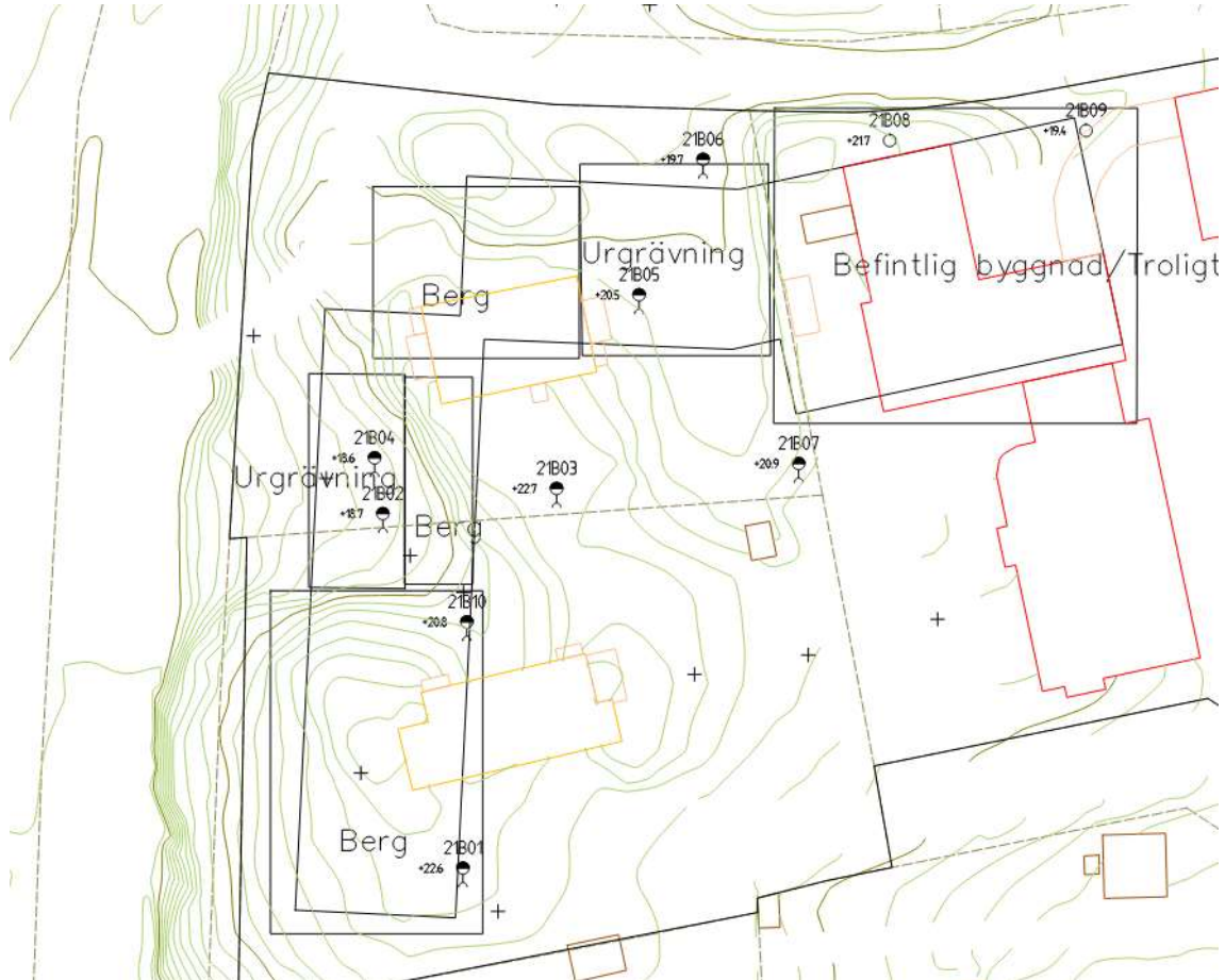
Figur 9-1. Bedömd grundläggningsmetod.

Vid grundläggning mot Roslagsbanan kan stödmur bli aktuellt beroende på grundläggningsnivå. Tolkad grundläggningmetod så som grundläggning på berg samt urgrävning redovisas i figur 2-1.