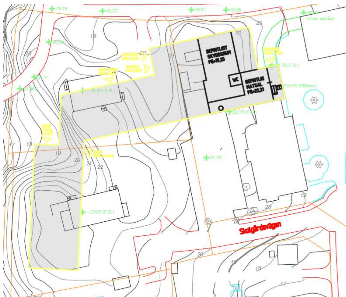
Figur 5-1 Förslag på planerad byggnad.