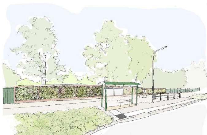
Skissbild som visar hur en grön vägg skulle kunna se ut.

Förutom att de är bullerdämpande och ger en naturkänsla skulle de också kunna bidra till biologisk mångfald, vara temperatursänkande och partikelreducerande. Platsen är intressant eftersom det är den mest trafikerade delen av sträckan.