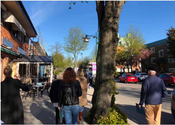
Områdesvandring längs Vendevägen och vid Djursholms torg