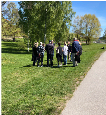
Områdesvandring i Samsöparken