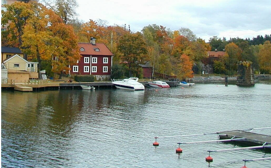
Det gamla brofästet med brovaktstugan och värdshuset