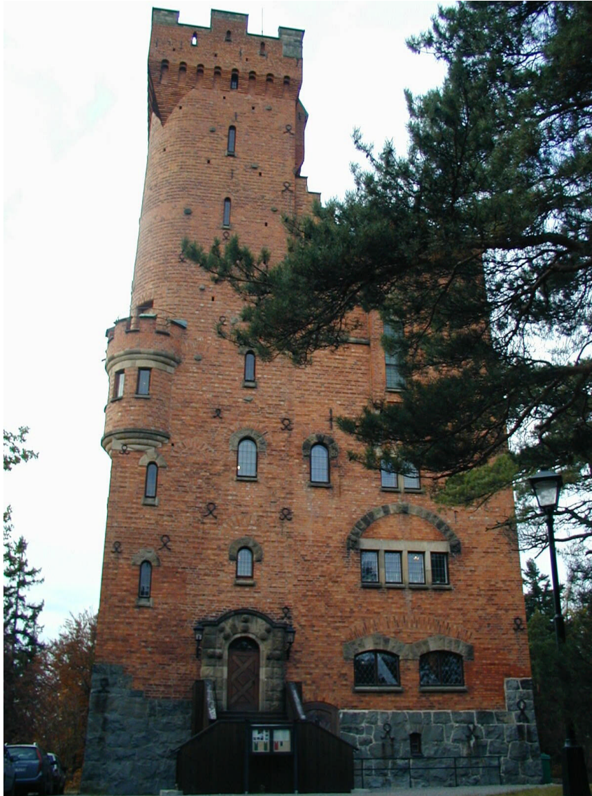
Cedergrenska tornet, Stocksund 2:160

Området är av regionalt intresse för kulturminnesvården.