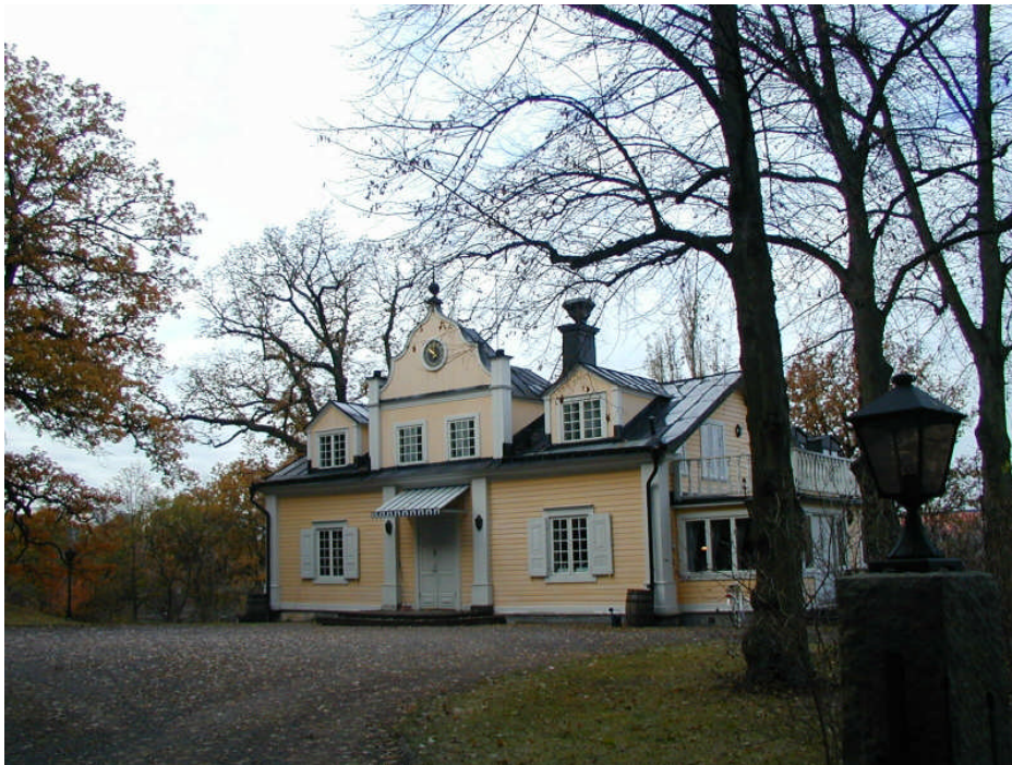
Skogshyddan 1, Stockholmsvägen 40

Innebär ett bebyggelseärende ett hot mot områdets särdrag bör detaljplanen ändras. Planens bestämmelser och beskrivning skall då utformas så att områdets karaktär enligt ovanstående punkter i allt väsentligt garanteras.