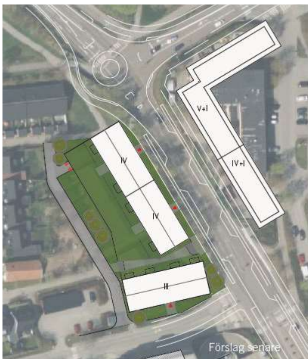
Exempel disposition för volymstudie av ny bebyggelse inom Plogan 12 och 13 (inklusive gaturum samt studerad bebyggelse på östra sidan Enebybergsvägen).

Idag finns ett stråk inom utredningsområdet, som fungerar som passage till gång- och cykelvägen öster om radhusen från angränsande kedjehusområde. Stråket som ingår i en gemensamhetsanläggning som förvaltas av en samfällighetsförening föreslås bibehållas alternativt dras om, beroende på hur den nya bebyggelsen placeras.