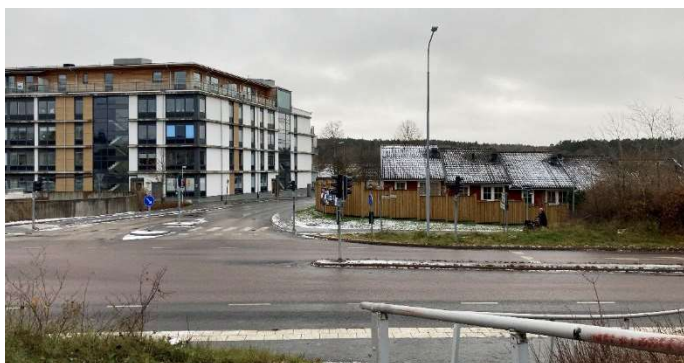
Korsningen Rosenvägen/Enebybergsvägen, med Eneby torg till vänster i bilden och radhusbebyggelsen inom Plogan 13 till höger.

Utredningsområdet gränsar till lokalgatan Rosenvägen i söder och Enebybergsvägen i öster. Flera gång- och cykelvägar finns i närområdet. Utmed Enebybergsvägen finns även ett regionalt cykelstråk, som ska rustas upp i samband med den planerade upprustningen av Enebybergsvägen.