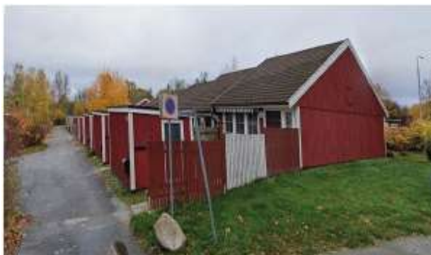
Foto från söder (Rosenvägen) mot radhusbebyggelsen inom Plogan 12 och 13.

Inom utredningsområdet finns 11 radhus uppdelade på två längor i nordsydlig riktning. På bostädernas östra sida finns en liten trädgård som avgränsas av en gång- och cykelväg samt ett smalt grönområde med träd och buskar som bildar en vall mot Enebybergsvägen. Entré till husen finns på västra sidan, vilken vetter mot kedjehusbebyggelse med tillhörande utemiljö. Bebyggelsen är uppförd under 1970-talet och har en våning och sadeltak.