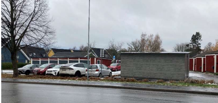
Foto från Rosenvägen mot befintlig parkeringsplats samt avfallshus.

ytterligare ca 15 bilar. De flesta av kedjehusen har ett garage och/eller en carport.