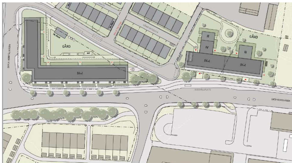
Utredningsskiss för pågående planarbete öster om Enebybergsvägen. (Norr till vänster i bilden).

Den nya bebyggelsen inom utredningsområdet ska anpassas till Enebybergsvägens planerade nya utformning och så att gaturummet upplevs attraktivt och funktionellt för alla som vistas i eller passerar området.