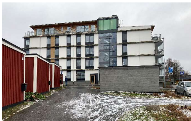
Foto från norr mot Eneby torg, med radhusbebyggelse som skymtar till vänster i bilden.

I söder angränsar området mot Eneby torg med service i form av vårdcentral, apotek, restauranger, livsmedelsbutik m.m.