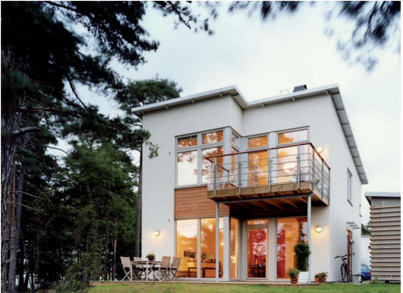
Referensbild från Trollåsen: Bebyggelsen uttrycker en samtida arkitektur. Liljewall arkitekter ab/Skanska Nya hem