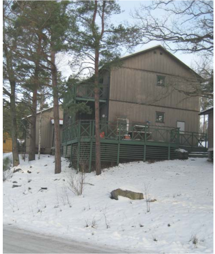
Exempel från Kullön som visar hur bebyggelsen kan naturanpassas.