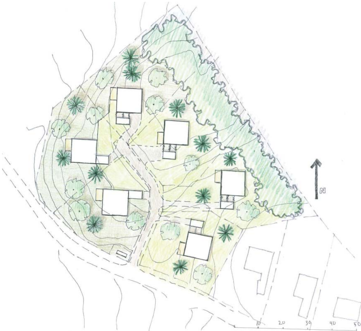
Illustration över den nya bebyggelsen. Bebyggelsens placering är baserad på en idé om att alla ska ha sjöutsikt samt att natuen ska bevaras så långt det är möjligt.

Byggnader skall huvudsakligen placeras så att de överensstämmer med illustrationen. Syftet är att de tomter som har möjligheter får sjöutsikt. Detta gäller även carport och garage.