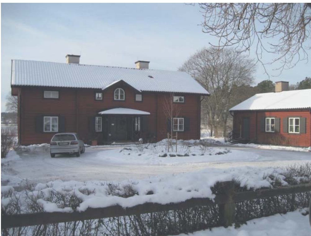
Sättra prästgård med en av flyglarna. Bebyggelsen har ett karaktäristiskt utseende med timrad fasad, sadeltak och rödfärgad fasad.

Byggnaderna är ej ursprungliga, varför bebyggelsen ändå skall kunna utvecklas. Fasadernas utseende med fönstersättning osv måste dock bibehållas. Större glaspartier och skyltar är ej önskvärda.