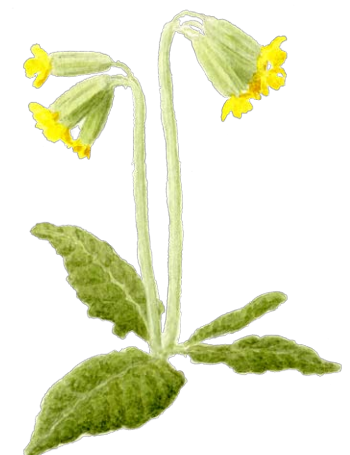
Gullviva . Finns i hagen.

Flora och fauna Ekebysjö naturreservat innefattar av många olika typer av vegetation, från sump- och kärrmark via beteshagar och slätterängar till torr hedvegetation och hållar. Varje vegetationsområde har sitt specifika växt- och djurliv. Flera områden utgör livsmiljöer för fridlysta eller hotade arter. Svarthakedopping och smådopping är exempel på de rödlistade arter som finns i reservatet. Ekebysjöns natur- och kulturhistoriska värden tillsammans med dess centrala läge gör det till ett värdefullt område.