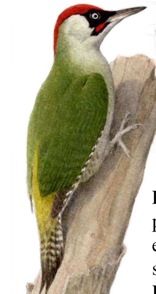
Gröngöling Äter myror på marken, har därför gräsgrön rygg. Trummar sällan men ropar flitigt och ljudligt.