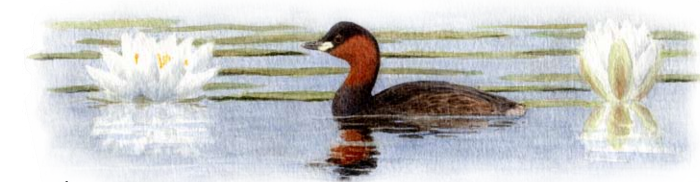
Smådopping . Liten som en andunge. Är expert på att gömma sig, till exempel bland de vita näckrosorna.

Flora och fauna Ekebysjö naturreservat innefattar av många olika typer av vegetation, från sump- och kärrmark via beteshagar och slätterängar till torr hedvegetation och hållar. Varje vegetationsområde har sitt specifika växt- och djurliv. Flera områden utgör livsmiljöer för fridlysta eller hotade arter. Svarthakedopping och smådopping är exempel på de rödlistade arter som finns i reservatet. Ekebysjöns natur- och kulturhistoriska värden tillsammans med dess centrala läge gör det till ett värdefullt område.