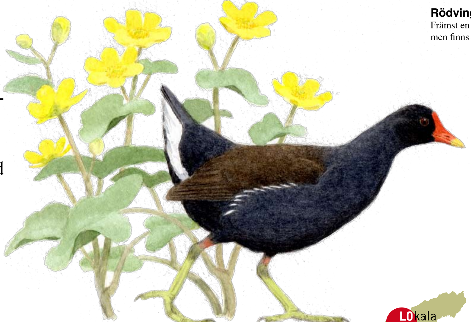
Kabbleka Blommar i slutet av maj i sumpskogen.