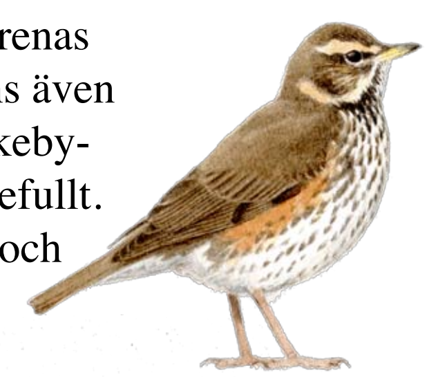
Rödvingetrast Främst en norrlandsfågel men finns i sumpskogen.