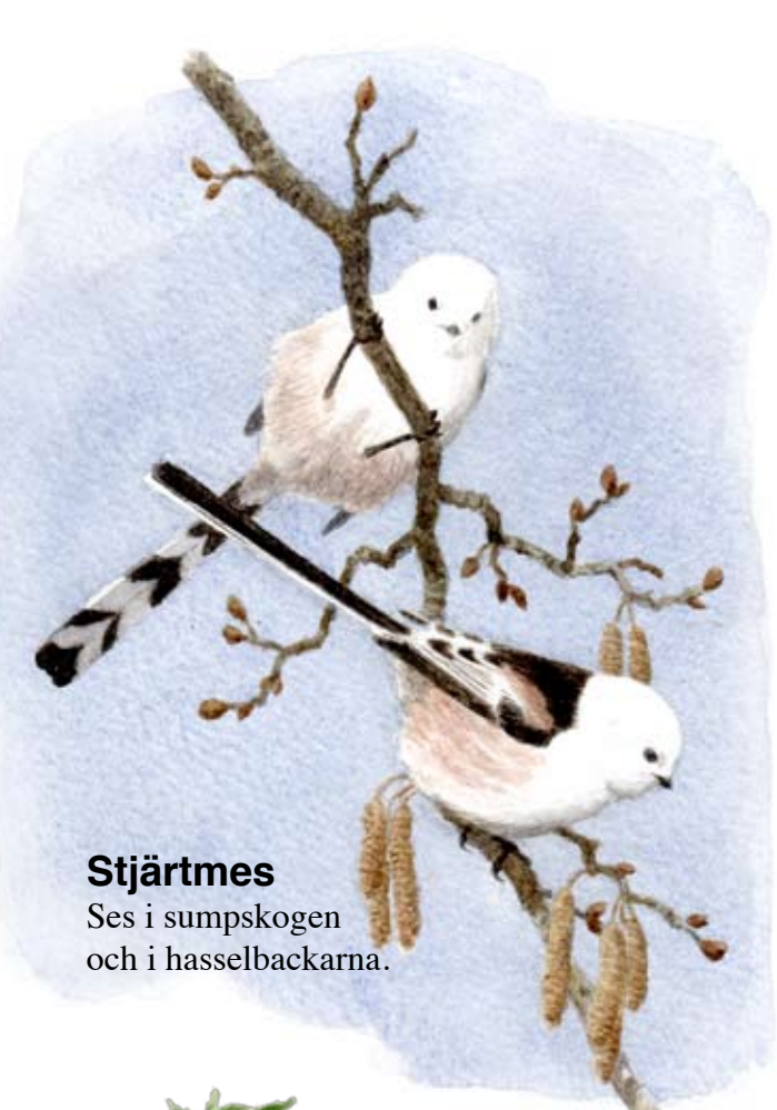
Stjærtmes Ses i sumpskogen och i hasselbackarna.