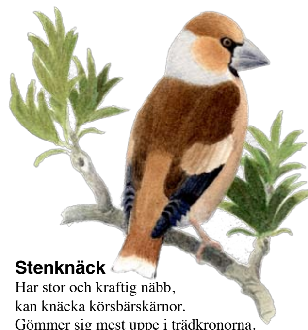
Stenknäck Har stor och kraftig näbb, kan knäcka körsbärskärnor. Gömmer sig mest uppe i trädkronorna.

Groddjur Ekebysjön är känd som reproduktionslokal för groddjur och utgör ett viktigt område för åkergroda, vanlig groda, vanlig padda och mindre vattensalamander. Sjön och dess in- och utflöden ingår i ett fuktstråk som fungerar som vandringsled för groddjur i Danderyd.