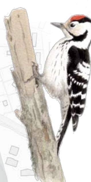
Mindre hackspett Inte större än "en vanlig småfågel". Kräver murkna, insektsangripna lövträd, trivs alltså i sumpskogen.