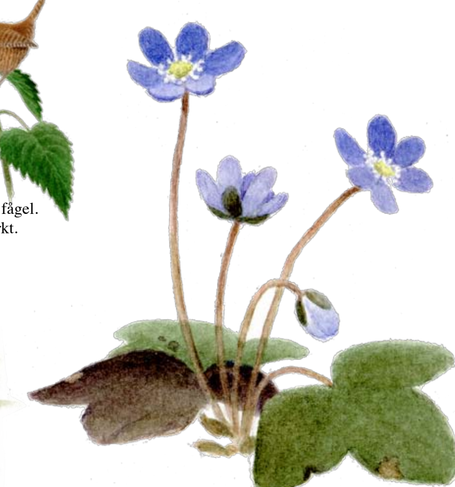
Blåsippa . Trivs i hasselbackarna.