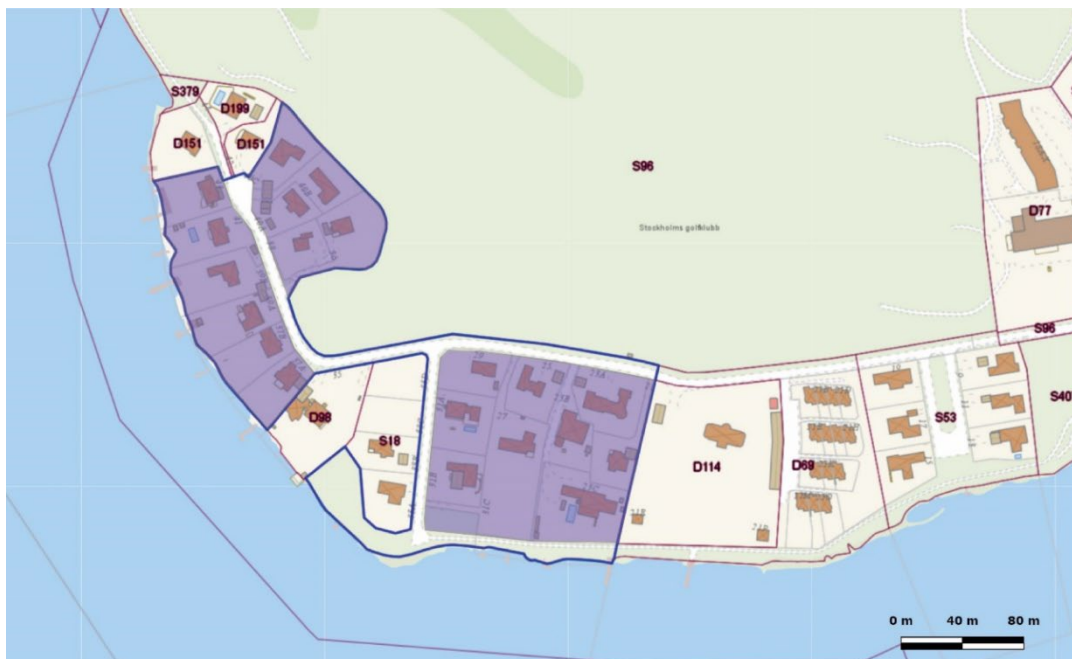
Planändringen berör de lilamarkerade fastigheterna