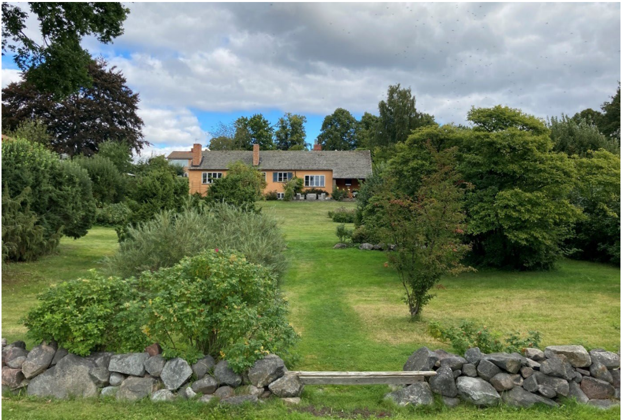
Fastigheten Fyren 11 med värdefull byggnad

Planändringsområdet utgörs av villakvarter med varierad bebyggelse i olika stil. Byggnaderna är i en till två våningar och har puts-, tegel- eller träfasader. Majoriteten av byggnaderna har sadeltak i tegel medan en del har flacka plåttak. Vissa byggnader som ligger i slutningen ned mot Edsviken är suterränghus. Fastighetsindelningen i kvarteren stämmer överens med gällande detaljplan från 1978, som dock medger styckning av fastigheten Fyren 11. De flesta fastigheter har tillhörande garage och parkeringsyta samt staket som avgränsar fastigheten. Byggnaden på fastigheten Fyren 11 är utpekad som värdefull byggnad och synlig för allmänheten från strandpromenaden.