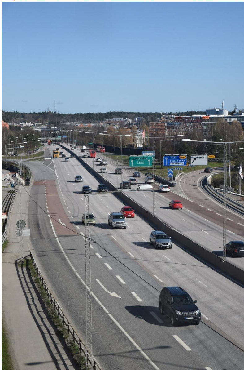
Bild ovan: E18 från Mörby centrum och norrut - Fotograf Maria Djurskog.

Trots förstärkt kollektivtrafik beräknas trafiken på E18 fortsätta öka, till stor del i form av genomfartstrafik. En eventuell tunnelförläggning av E18 skulle medföra mer hälsosamma livsmiljöer (buller och luftkvalitet) och mindre barriäreffekter för människor och djur. Dessutom skulle omvandlingen av E18 till stadsgata göra det möjligt att lokalisera en omfattande ny bebyggelse i E18-området längsmed denna gata. Program för fördjupning av översiktsplanen för centrala Danderyd finns på kommunens webbplats eller här .