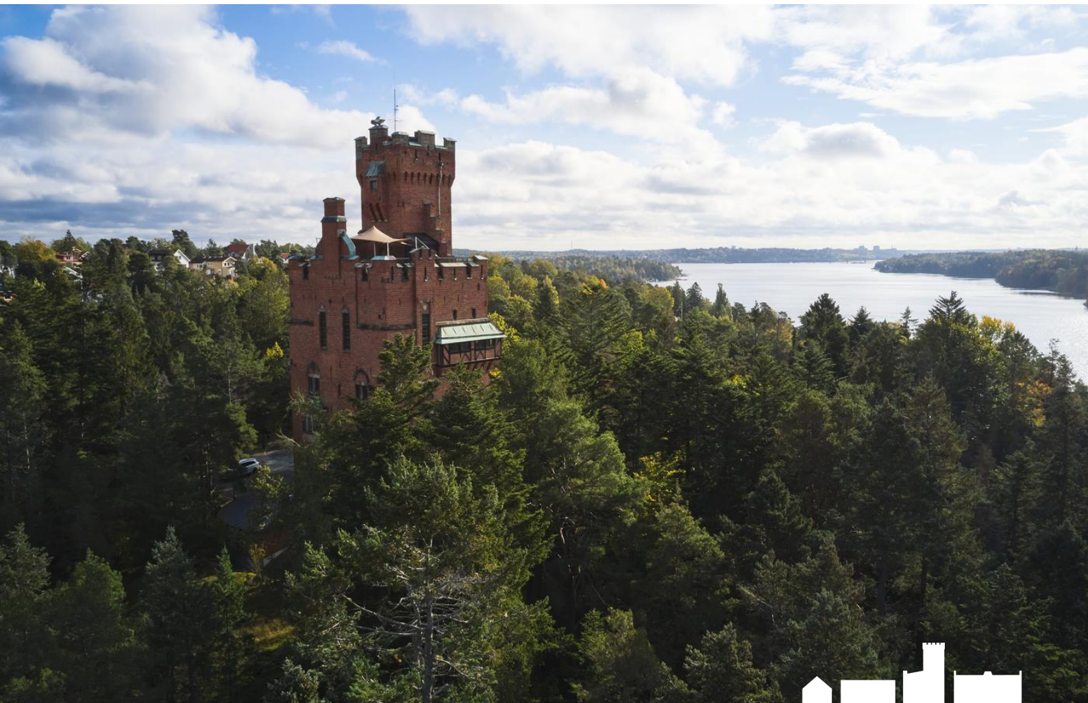
Cedergrenska tornet – Fotograf Erik Somnäs 2020