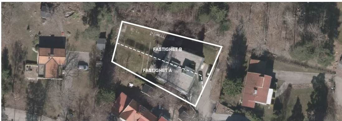
Illustration av fastighetsindelningsbestämmelsen

Bestämmelser om fastighetsindelning införs i detaljplanen för att säkerställa en ändamålsenlig indelning av fastigheterna. Den nya fastighetsgränsen dras genom mitten av befintligt parhus. De nya fastigheterna blir 472 kvm (lotten A) respektive 535 kvm (lotten B). Fastighetsgränsen föreslås snedställas i öster för att möjliggöra angöring för Lotten B. En bestämmelse om att 450 kvm är minsta fastighetsstorlek föreslås.