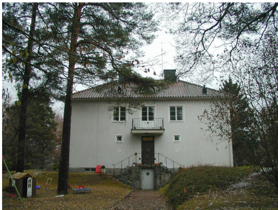
Gerd 17, Hildingavägen 63

På båda sidor om järnvägen norrut och kring Ösbyparken ligger ett flertal relativt stora villor i kuperad terräng. Även tomterna är ganska stora med en växtlighet som varierar mellan ren naturmark och väl ansade trädgårdstomter.