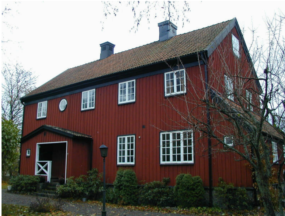
Tor 11, Stenbocksvägen 11