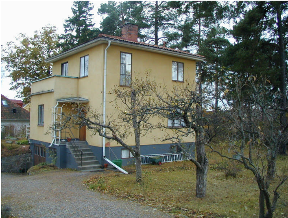
Bågen 2, Skogsdalsvägen 27

För området finns en detaljplan från 1929, en från 1956 samt en från 1978. Den äldsta planen har bestämmelser om minsta tomtstorlek på 1 200 kvm och tomterna får bebyggas till 1/8 i en vånings höjd. Denna plan medger två kök per fastighet. De yngre planerna medger att 1/5 bebyggs med envånings bostadshus.