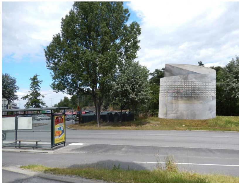
ventilationshuv med fasad av rostfri plåt i Mörby

Två ventilationsschakt samt del av kabeltunneln planeras inom Danderyds kommun, varav denna bygglovsansökan gäller det ena schaktet.