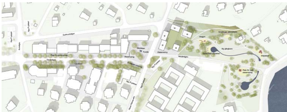
Föreslagen ombyggnad av allmän plats mellan Auravägen och Samsöviken.

I dialogen har kommunen framfört att det finns ett tydligt samband mellan ny bebyggelse och investeringar i allmän plats då upprustningen i föreslagen omfattning är mycket kostsam. De ekonomiska aspekterna av projektets genomförande kommer redovisas för kommunstyrelsen.