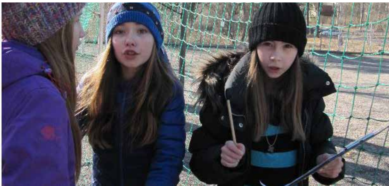
Elever från Stocksundsskolan diskuterar vad de gillar med just denna plats

Syftet med att involvera skolorna är framförallt att ge eleverna en möjlighet att diskutera och problematisera sin egen och skolans närmiljö. Att eleverna utifrån sina upplevelser och erfarenheter förmedlar vad de tycker om sin närmiljö och fritt fantiserar om framtiden. Arbetet med skoleleverna är även viktigt då det ger kunskap om kommande generationers perspektiv på centrala Danderyds utveckling. Detta är ett perspektiv som annars kan vara svårt att fånga i dialoger med allmänheten.